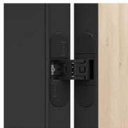
zawiasy 3D w kolorze ościeżnicy