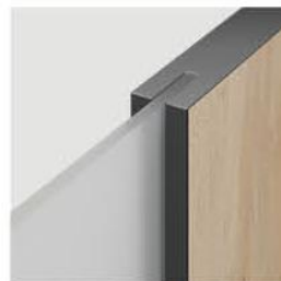
łączenie z szybą

W ofercie dostępne są dwa modele przeszklone i jeden pełny w wielu pokryciach z oferty PORTA.